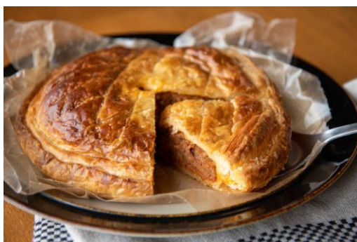
ビーフミートパイ 2,800 円

セイボリーパイで人気 NO.1。トマトベースの牛挽肉と玉ねぎがぎっしり詰まり、ボリューム満点でメインになる一品。トースターで温めるとパイ生地サクサク感と牛肉の旨味がさらに増します。