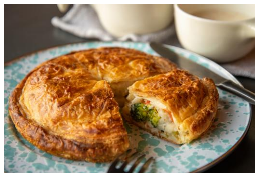
チキンポットパイ 2,300 円

ホワイトソースにゴロゴロのチキンと人参、ブロッコリー、カリフラワーなどの野菜がたっぷり入ったパイです。野菜がしっかり取れるので、大人はもちろん、お子さんにもおすすめ。