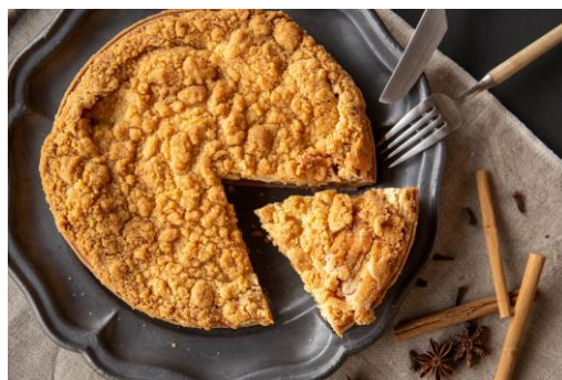
ダッチアップルパイ 3,300 円

自家製スパイスで自然の甘みを引き出したりんごが入ったスイーツパイ。上に乗せたクランブルのザクザク食感がアクセントになっています。常温で食べるのがおすすめなので、手土産にも使いやすい一品です。