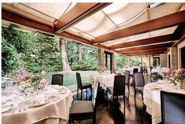
(パーティー会場イメージ)

HP : https://www.tgn.co.jp/hall/omotesando/ha/