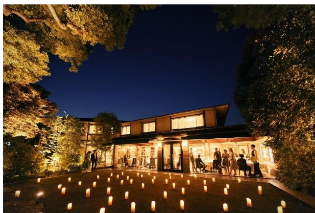
(ナイトウェディングイメージ)