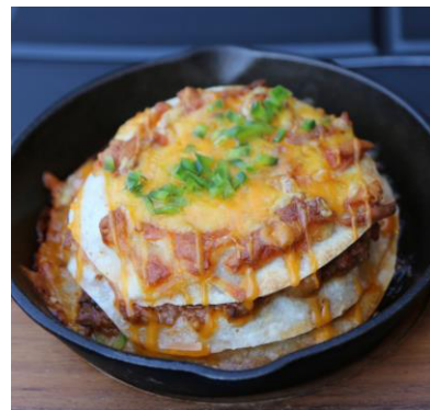
メキシカンミートパイ 1,000 円

チーズとチリコンカーンが入った大きさ 21 cm のパイ。ワカモレ、メキシカンサルサ、サワークリームのソースで3種類の味が楽しめます。