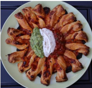
メキシカントリオパイ 2,500 円

チーズとチリコンカーンが入った大きさ 21 cm のパイ。ワカモレ、メキシカンサルサ、サワークリームのソースで3種類の味が楽しめます。