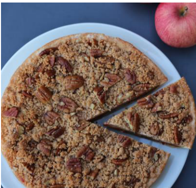
テキスメクスアップルパイ 550 円 (1P)

スパイスとパプリカを合わせたジャムが入り、甘さにスパイシーさが掛け合わさったアップルパイ。クリームチーズを混ぜたクランブルをプラスすることでスパイシー過ぎず食べやすい味です。ピーカンナッツのザクザク食感もアクセントに。