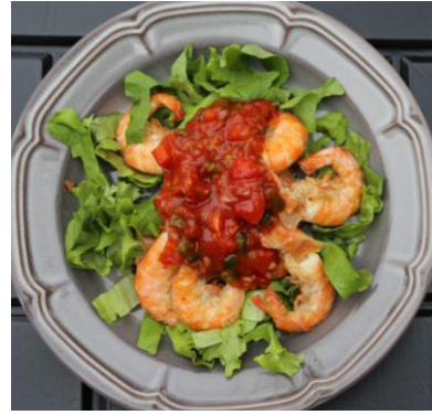
ソフトシェルシュリンプソテー メキシカンサルサ 1,900 円

アンガス牛サーロインステーキにメキシコ風ソースをかけました。アンガス牛は、スコットランド発祥の牛でやわらかい肉質が特徴。フライドポテトを添えてボリュームたっぷりの一皿です。