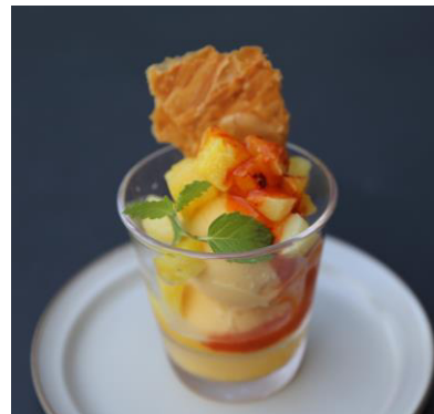
チャモイヤーダマンゴーアイス 600 円

スパイスとパプリカを合わせたジャムが入り、甘さにスパイシーさが掛け合わさったアップルパイ。クリームチーズを混ぜたクランブルをプラスすることでスパイシー過ぎず食べやすい味です。ピーカンナッツのザクザク食感もアクセントに。