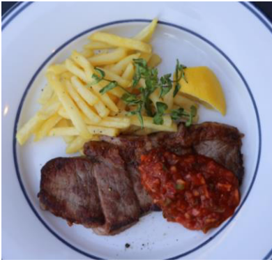
アンガスビーフステーキ メキシカンサルサ 2,200 円

アンガス牛サーロインステーキにメキシコ風ソースをかけました。アンガス牛は、スコットランド発祥の牛でやわらかい肉質が特徴。フライドポテトを添えてボリュームたっぷりの一皿です。